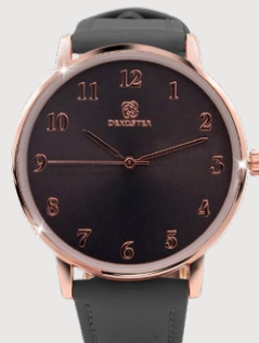
Armbanduhr Candy grau 1190820-00 ♦ €69 90