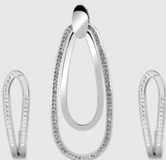
Set Sarah · 2980739-00 um nur € 20 24

ab 400€ 1 VON 15 SCHMUCKSTÜCKEN KOSTENLOS ODER 1 AUS 5 SETS UM NUR €20 24