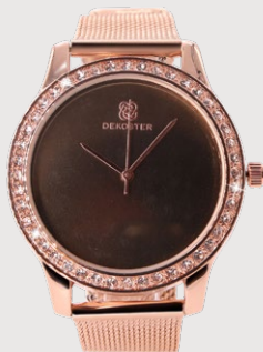
Armbanduhr Mesh Glamour 1190900-00 ♦ €109 90