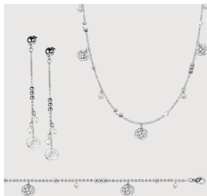
Set Aphrodite · 2980702-02 um nur € 20 24

Ohringe · 7521830-00 ♦ Wert €44 90 Anhänger · 7562200-00 ♦ Wert €39 90 Stahlreif · 7580650-00 ♦ Wert €39 90