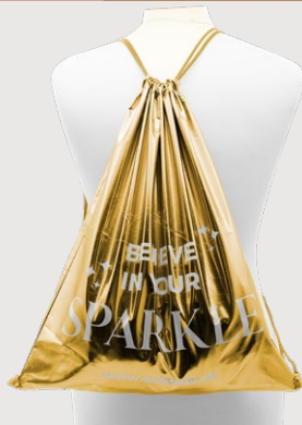
Goldener Turnbeutel 6500060-00 / €14 90