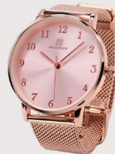
Armbanduhr Candy Mesh rosa 1190830-00 ♦ €79 90

ab 400€ 1 VON 15 SCHMUCKSTÜCKEN KOSTENLOS ODER 1 AUS 5 SETS UM NUR €20 24