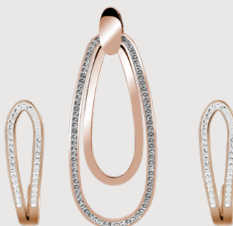
Set Sarah · 2980739-01 um nur € 20 24

Ohringe · 7522330-00 ♦ Wert €54 90 Anhänger · 7562330-00 ♦ Wert €54 90