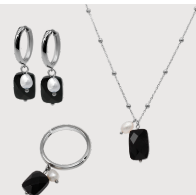
Set Marlie Black · 2980716-01 um nur € 20 24

Ohringe · 7521786-42 ♦ Wert €44 90 Collier 45cm · 7540696-45 ♦ Wert €69 90 Armband · 7531786-42 ♦ Wert €49 90